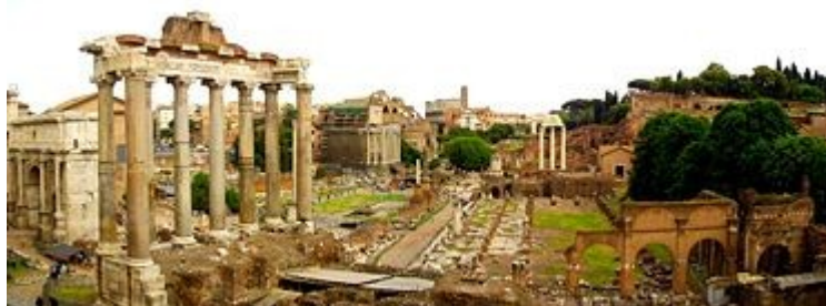
Forum Romanum dnes

Podle starořímských pramenů se založení města Říma datuje do roku 753 př. n. l. , což bylo později přijato za počátek římského letopočtu ( ad urbe condita – od založení města). Zřejmě již od 10. století př. n. l. existovala na Kapitolu a Palatinu první sídla. Později se osady rozšířily i na okolní pahorky při řece Tiberu , z kterých pak jejich pozvolným spojováním vzniklo město, jehož náboženským a politickým centrem se stal Kapitol. Založení města uprostřed 8. století př. n. l. se zhruba kryje s počátkem řecké kolonizace Itálie .