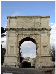
Titův vítězný oblouk

Po Neronově smrti nastal v říši chaos („ rok čtyř císařů “). Z bojů mezi jednotlivými uchazeči o trůn vyšel vítězně vojevůdce Vespasianus , který založil druhou císařskou dynastii Flaviovců . Vespasianus se pokoušel uspořádat rozvrácené státní finance a zajistit hranice říše na východě před pronikáním Parthů. Když po vesměs úspěšné vládě v roce 79 zemřel, stal se císařem jeho syn Titus , který v roce 70 převzal po svém otci velení v židovské válce a zvítězil v ní. Titovi bylo dopřáno jen krátké vládnutí, jež se navíc vyznačovalo převážně katastrofami (výbuch Vesuvu , morová epidemie). I přesto byl v Římě v roce 80 dokončen velkolepý Flaviovský amfiteátr . Po Titově předčasném skonu o rok později nastoupil jeho bratr Domitianus , jehož vláda je v pramenech, zejména Tacitem , vyličená v temných barvách. Domitianus požadoval, aby mu byla prokazována božská úcta a jmenoval se dominem (pánem nad otroky). Svým stylem vlády provokoval staré elity, nicméně je nutné uznat i jeho nepochybné úspěchy ve válkách proti Britanům, Germánům a Dákům . Rovněž vytvořil velmi efektivní správní systém. V roce 96 však padl za obětí palácovému převratu.